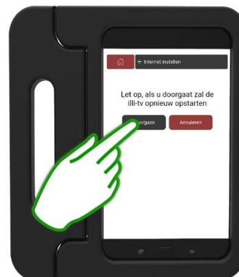
Stap 6 Klik op Doorgaan . De illi-tv start opnieuw op