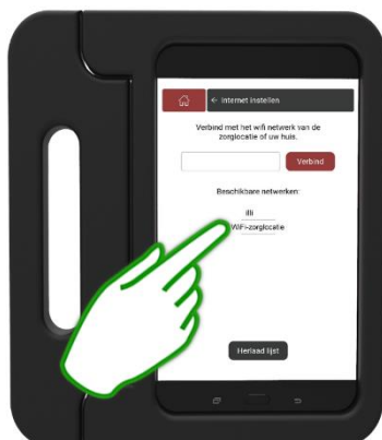
Stap 4 Selecteer de WiFi naam van de zorglocatie