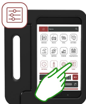
Stap 7 Druk op Opties