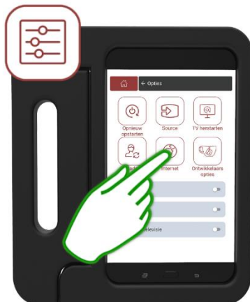
Stap 2 Druk op Internet