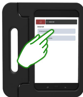
Stap 9 Druk op Internetcheck