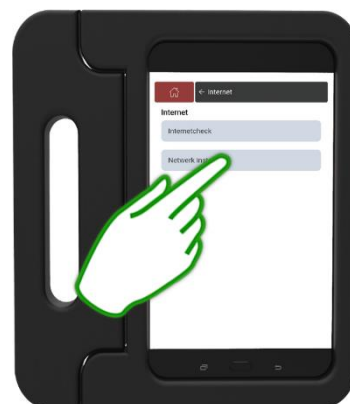
Stap 3 Druk op Netwerk instellen