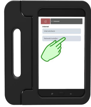
Stap 3 Druk op Netwerk instellen