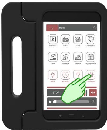
Stap 1 Druk op Instellingen

Volg onderstaande stappen om de illi-tv te koppelen aan de WiFi verbinding van de zorglocatie. Hierdoor zal de illi-tv automatisch beschikken over de nieuwste video's en kunnen de meeste storing op afstand worden opgelost.