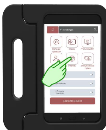
Stap 8 Druk op Internet