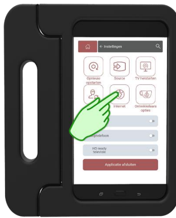
Stap 2 Druk op Internet