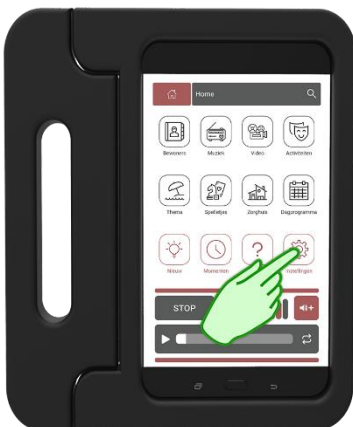
Stap 7 Druk op Instellingen