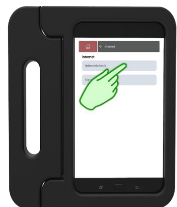
Stap 9 Druk op Internetcheck