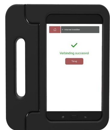
Stap 6 Kijk of de verbinding is gelukt. Klik op Terug