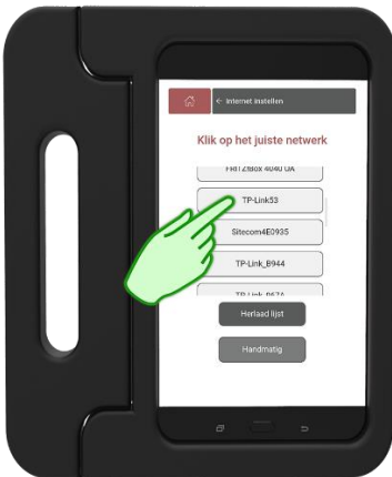
Stap 4 Selecteer de WiFi naam van de zorglocatie